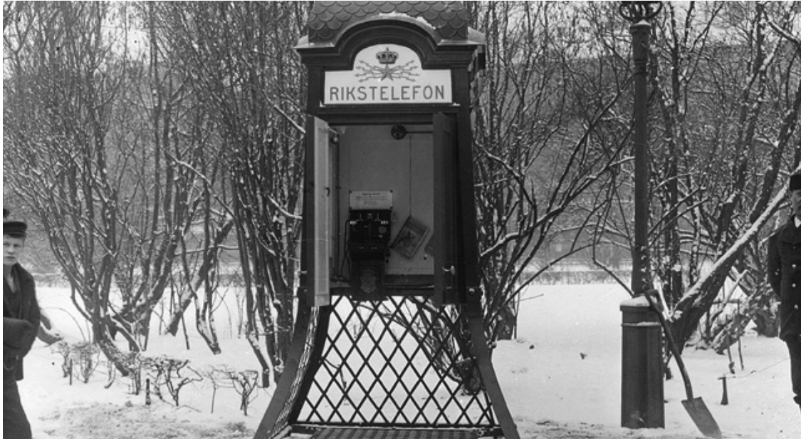
Stockholms första telefonkiosk som uppsattes i Kungsträdgården i mars 1901.

I början av 1900-talet började telefonkiosker sättas upp runt om i Sverige. Även de som inte hade telefon hemma kunde ringa ett samtal. Idag är telefonkioskerna sällsynta.